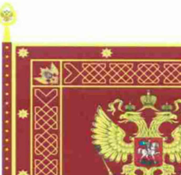
РИСУНОК ТИПОВОГО ОБРАЗЦА ЗНАМЕНИ ТЕРРИТОРИАЛЬНОГО ОРГАНА ФЕДЕРАЛЬНОЙ СЛУЖБЫ ВОЙСК НАЦИОНАЛЬНОЙ ГВАРДИИ РОССИЙСКОЙ ФЕДЕРАЦИИ

Российской Федерации от 30 декабря 2019 г. N 637