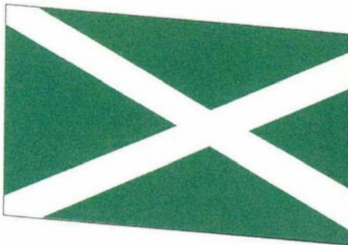
РИСУНОК ВЫМПЕЛА ВОДНЫХ СУДОВ ТАМОЖЕННЫХ ОРГАНОВ РОССИЙСКОЙ ФЕДЕРАЦИИ

Утвержден Указом Президента Российской Федерации от 16 июля 2019 г. N 335