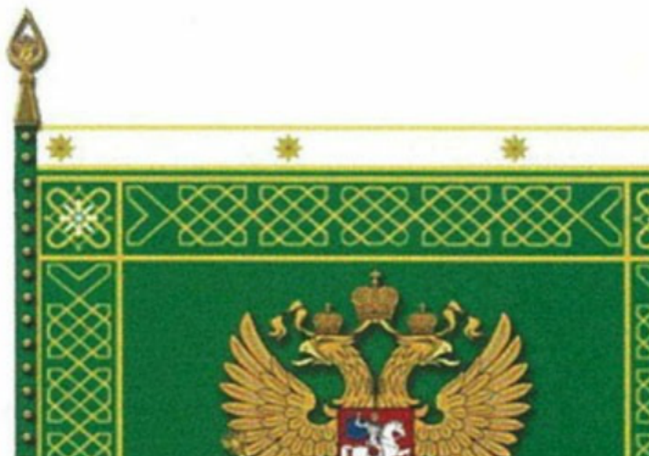
РИСУНОК ЗНАМЕНИ ФЕДЕРАЛЬНОЙ ТАМОЖЕННОЙ СЛУЖБЫ

Утвержден Указом Президента Российской Федерации от 16 июля 2019 г. N 335