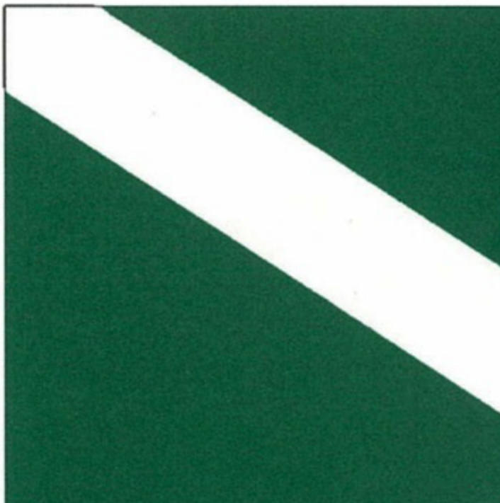
РИСУНОК ФЛАГА ФЕДЕРАЛЬНОЙ ТАМОЖЕННОЙ СЛУЖБЫ

Утвержден Указом Президента Российской Федерации от 16 июля 2019 г. N 335