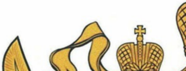
РИСУНОК ЭМБЛЕМЫ ФЕДЕРАЛЬНОЙ ТАМОЖЕННОЙ СЛУЖБЫ

Утвержден Указом Президента Российской Федерации от 16 июля 2019 г. N 335