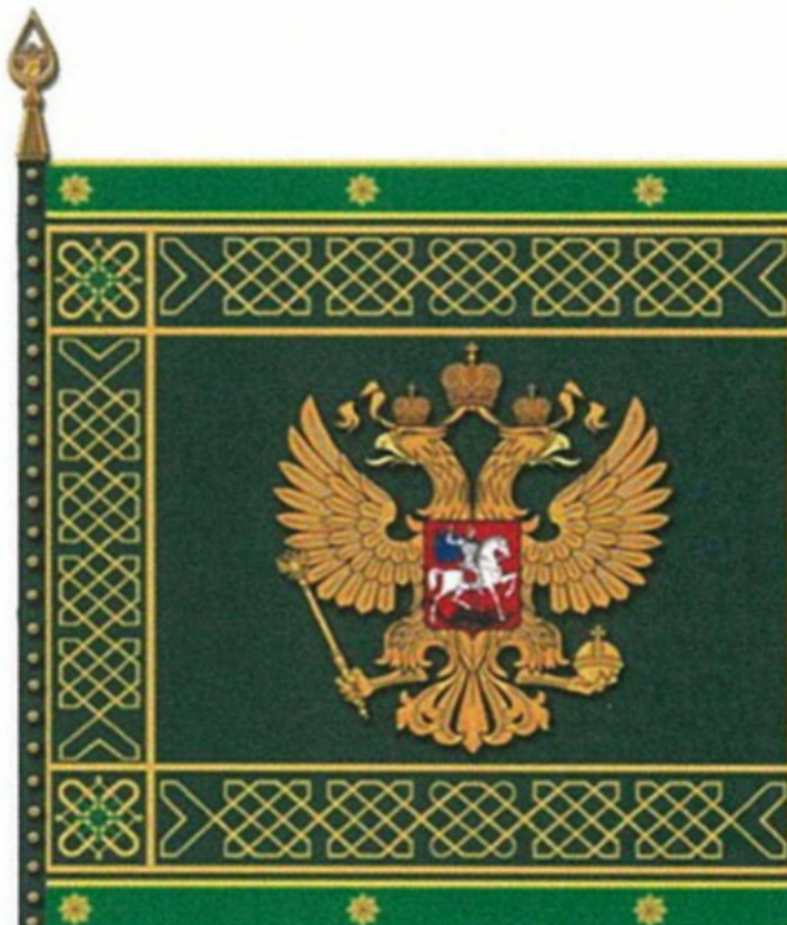
РИСУНОК ТИПОВОГО ОБРАЗЦА ЗНАМЕНИ РЕГИОНАЛЬНОГО ТАМОЖЕННОГО УПРАВЛЕНИЯ