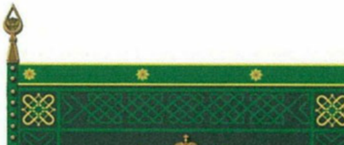
РИСУНОК ТИПОВОГО ОБРАЗЦА ЗНАМЕНИ ТАМОЖНИ

Утвержден Указом Президента Российской Федерации от 16 июля 2019 г. N 335