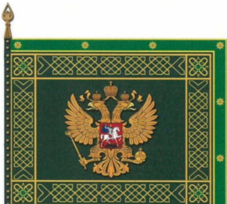
РИСУНОК ТИПОВОГО ОБРАЗЦА ЗНАМЕНИ РЕГИОНАЛЬНОГО ТАМОЖЕННОГО УПРАВЛЕНИЯ

Утвержден Указом Президента Российской Федерации от 16 июля 2019 г. N 335