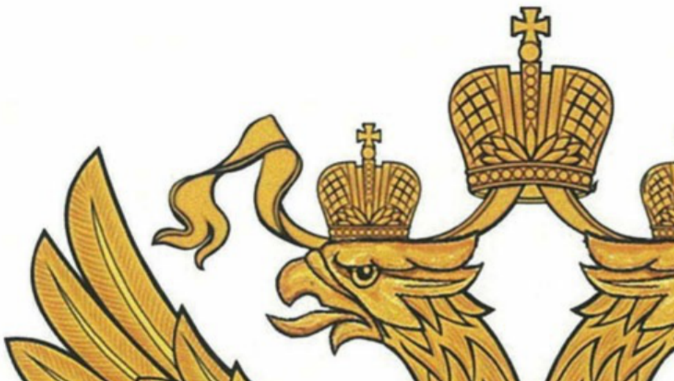
РИСУНОК ЭМБЛЕМЫ ФЕДЕРАЛЬНОЙ ТАМОЖЕННОЙ СЛУЖБЫ

Утвержден Указом Президента Российской Федерации от 16 июля 2019 г. N 335