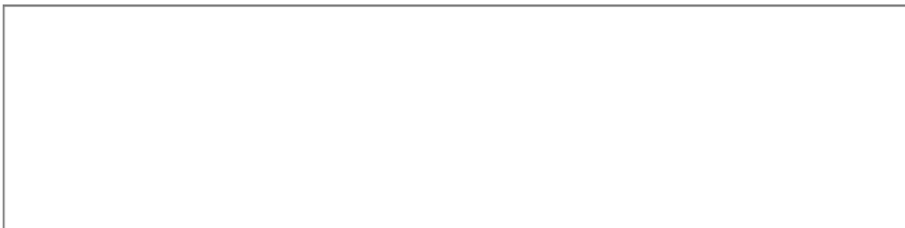
РИСУНОК ПАМЯТНОЙ МЕДАЛИ "ЗА СТРОИТЕЛЬСТВО КРЫМСКОГО МОСТА"

Утвержден распоряжением Президента Российской Федерации от 21 августа 2018 г. N 227-рп