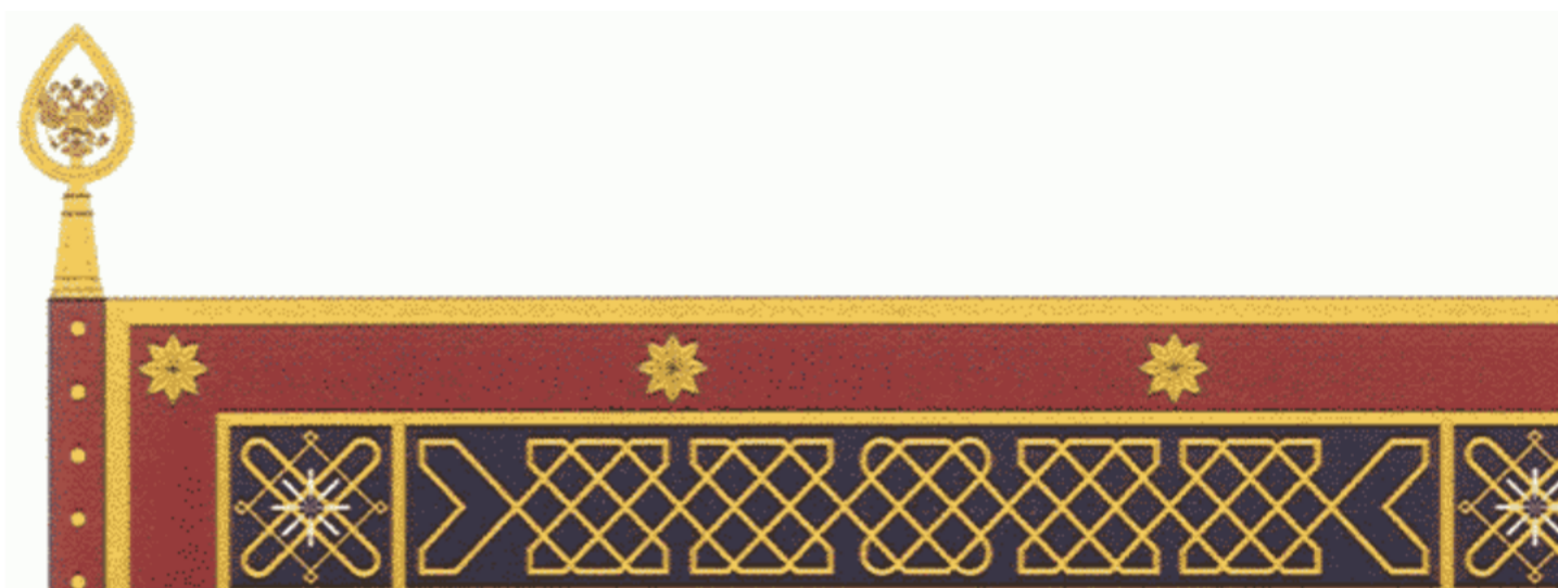
РИСУНОК ЗНАМЕНИ МИНИСТЕРСТВА ВНУТРЕННИХ ДЕЛ РОССИЙСКОЙ ФЕДЕРАЦИИ

Утвержден Указом Президента Российской Федерации от 12 июля 2012 г. N 983