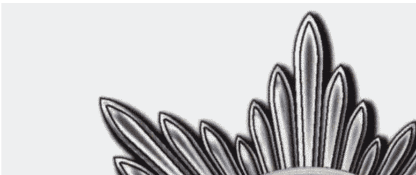
РИСУНОК ЗВЕЗДЫ ОРДЕНА СЯТОЙ ВЕЛИКОМУЧЕНИЦЫ ЕКАТЕРИНЫ

Утвержден Указом Президента Российской Федерации от 3 мая 2012 г. N 573