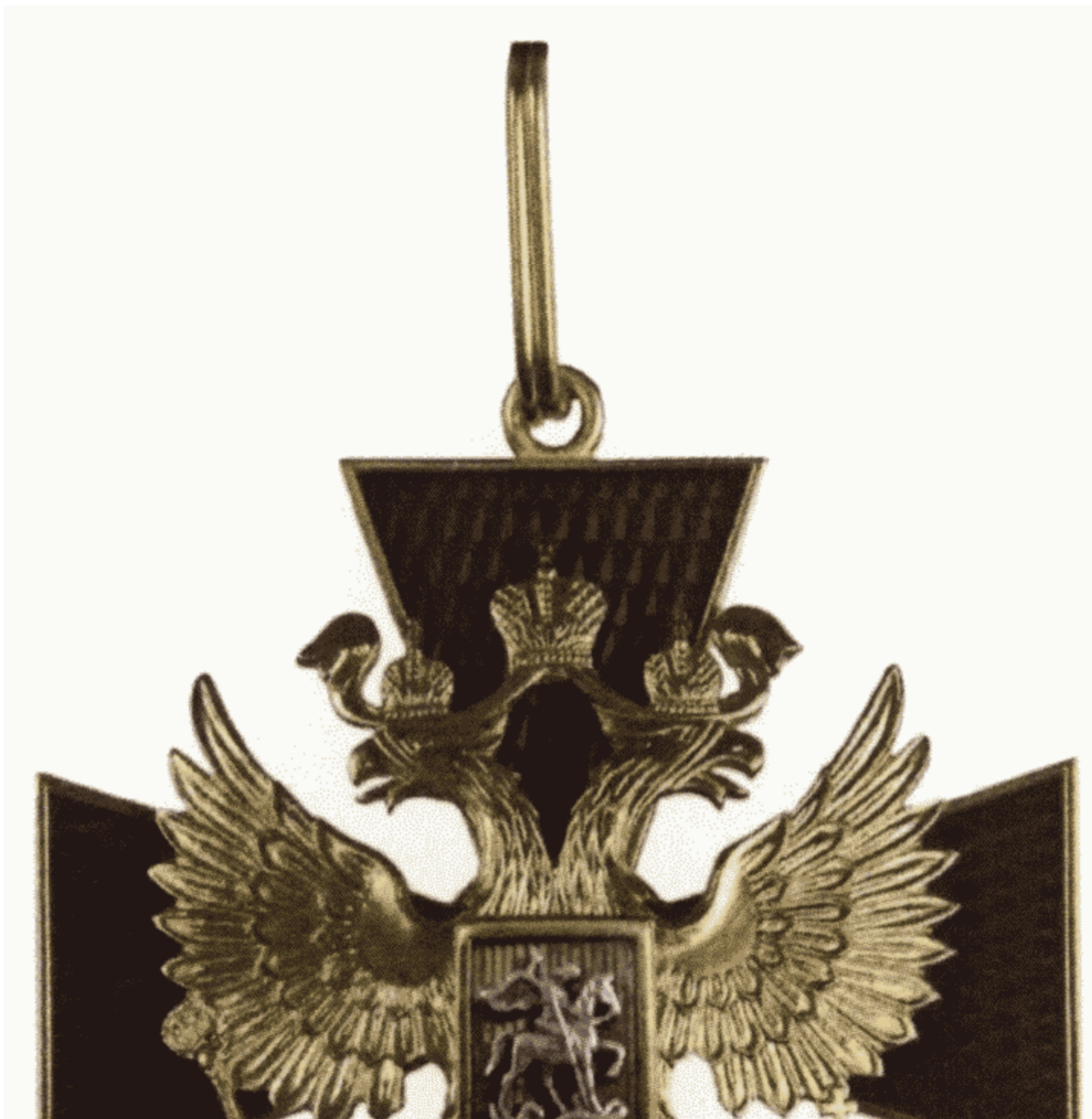
РИСУНОК знака ордена "За заслуги перед Отечеством" I степени

Приложение N 3 к Указу Президента Российской Федерации от 16 декабря 2011 г. N 1631