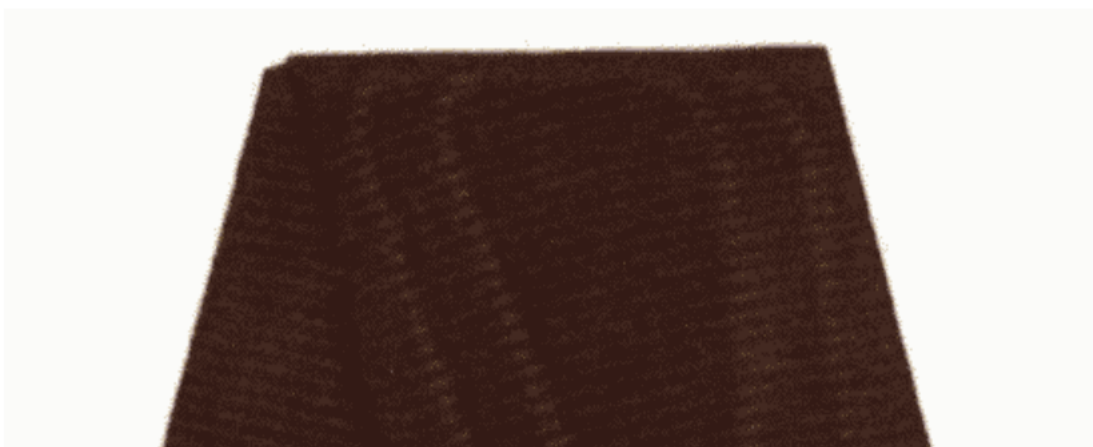
РИСУНОК знака ордена "За заслуги перед Отечеством" IV степени