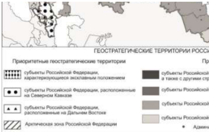
Схема размещения геостратегических территорий Российской Федерации

Приложение N 5 к Стратегии пространственного развития Российской Федерации на период до 2025 года